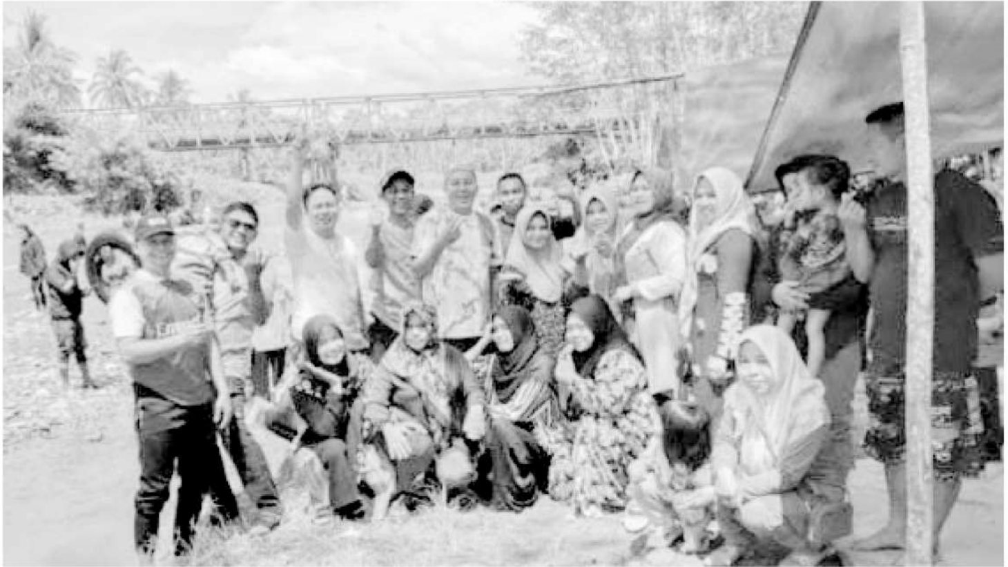
Tempat wisata di Kabupaten Balangan ramai dikunjungi warga sekitar maupun warga luar saat libur panjang pada Idul Fitri 1445 Hijriah ini. (ist)

Tempat wisata di Kabupaten Balangan ramai dikunjungi warga sekitar maupun warga luar saat libur panjang pada Idul Fitri 1445 Hijriah ini. Hal itu seperti yang disampaikan oleh Plt Kepala Disporapar Balangan Melda Risdha Elfa.