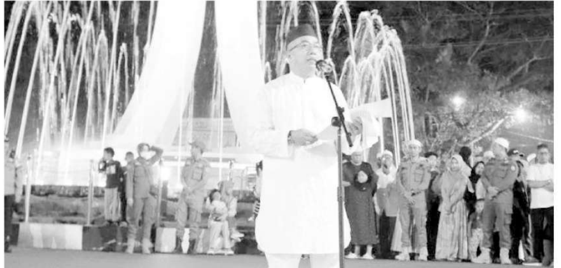
Penjabat Bupati Tapin Muhammad Syarifuddin melepas peserta pawai takbiran malam 1 syawal.

Para peserta pawai takbiran keliling kota Rantau mulai star di depan kediaman Rumah Jabatan Bupati Tapin - Jalan Tasan Pany, Jalan Haji Isbat- Jalan Kelurahan Kupang- Jl Desa Bungur- By Pass- Bundaran Dulang finis di Jalan Depan Rumah Jabatan