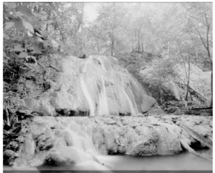
Air Terjun Manyandar salah satu objek wisata di Kabupaten Balangan.

Diketahui untuk menuju tempat Wisata Sungai Maranting pengunjung harus menempuh perjalanan sekitar