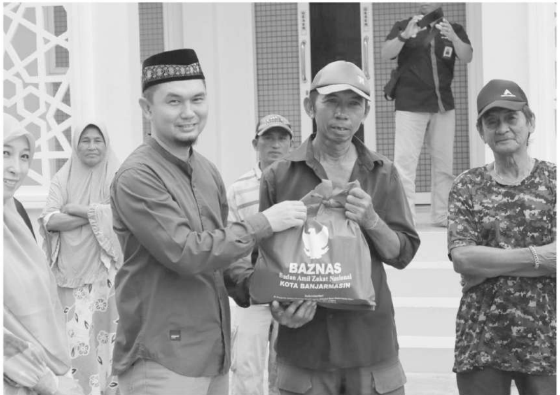
Direktur RSUD Sultan Suriansyah menyerahkan langsung Zakat Fitrah kepada warga sekitar.

“Kami sebagai warga sekitar RSUD Sultan Suriansyah mengucapkan terima kasih,” tandasnya. (fdl/asp)