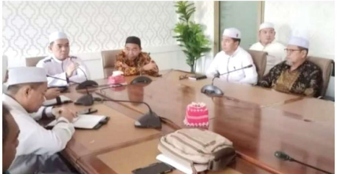
Pemkab Tanah Bumbu bahas persiapan acara Mapanreritasie. (ist)

Pemerintah Kabupaten Tanah Bumbu (Tanbu), membahas dan mempersiapkan rangkaian acara Mapanreritasie dalam rangka memperingati HUT ke-21 kabupaten yang berjudul “Bumi Bersujud”.