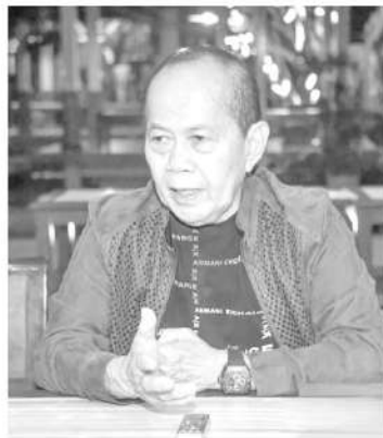
Wakil Ketua MPR RI Sjarifuddin Hasan.

Menurut dia, tewasnya Danramil Aradide ini merupakan insiden kesekian kalinya yang tidak hanya merenggut korban jiwa, tetapi juga mencederai integritas kedaulatan negara. Peristiwa ini, kata Syarif, harus menjadi titik tolak pendekatan