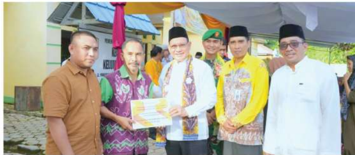
SAFARI - Bupati Kotabaru H. Sayed Jafar, SH beserta jajaran melanjutkan Safari Ramadan di wilayah mereka, Sabtu (6/4/2024) kemarin.

“Bupati beserta jajaran Pemerintah Daerah Kotabaru dalam bersilaturahmi sekaligus memberikan bantuan kepada masyarakat”