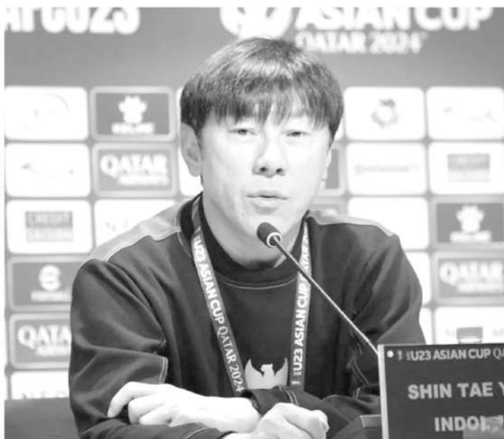
Pelatih timnas Indonesia U-23 Shin Tae-yong menghadiri konferensi pers pra pertandingan perdana Piala Asia U-23 di Qatar, Minggu (14/4/2024).

Kompetisi Piala Asia U-23 yang tidak masuk dalam agenda resmi FIFA juga membuat Shin memiliki sedikit rintangan untuk mempersiapkan pasukan terbaiknya. Walaupun demikian, pelatih asal Korea Selatan itu akan mengerahkan