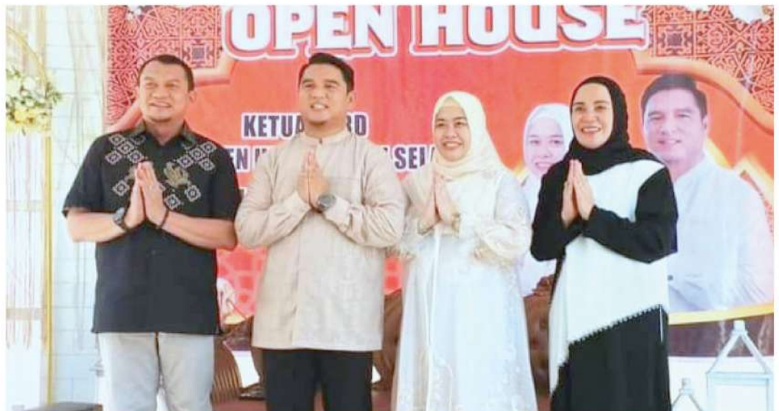
SILATURAHMI - Pj Bupati HSS Hermansyah silaturahmi dengan tokoh penting di HSS.

Momen perayaan Idul Fitri, Penjabat (Pj) Bupati Hulu Sungai Selatan (HSS) bersama istri kunjung silaturahmi ke pejabat dan tokoh penting yang telah berkontribusi terhadap pembangunan di Bumi Rakat Mufakat.